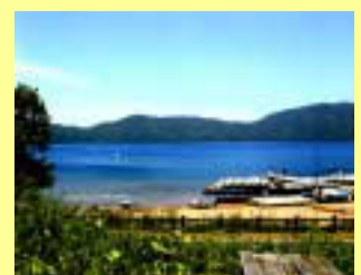
倶多楽湖 Lake Kuttara