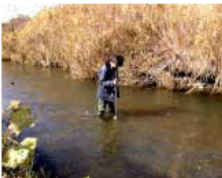
Examination of river