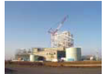
苫東地域開発状況調査 Survey of developments in Tomatoh area