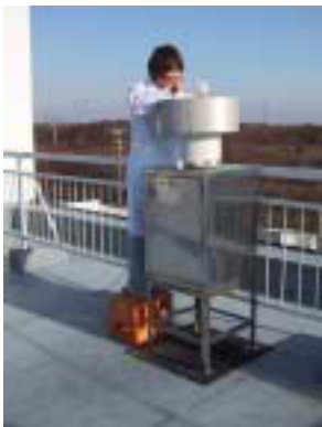
Examination of acid rain