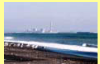
海域 Tomakomai sea area