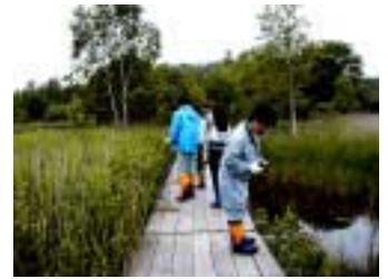
環境調査 Environment monitoring

その他各種調査を実施しています。 We survey environment periodically